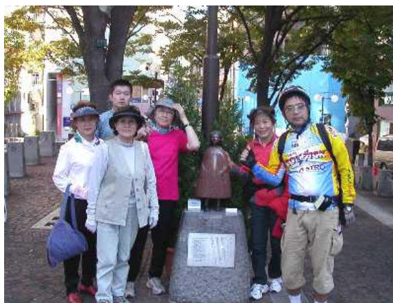
麻布十番にある「きみちゃん」像

港区のトリビアを探すポタリングです。愛宕山から東京タワー、高輪の首かしげのトンネル、住所が実は港区の品川駅、あっと驚くへらブナの釣り堀、赤い靴はいてた女の子「きみちゃん」像などなど…。よく見ると不思議いっぱいの港区を巡ります。