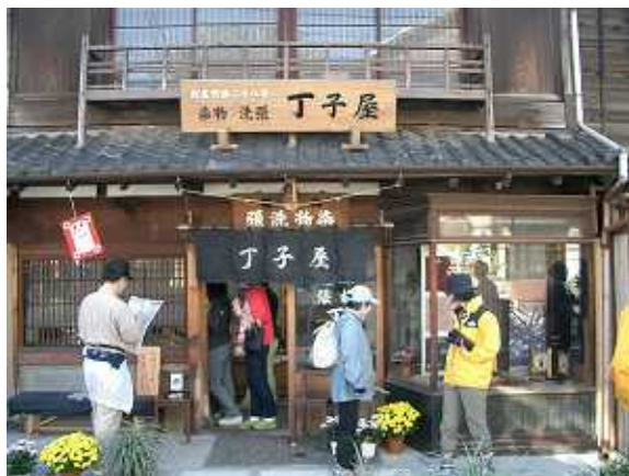
谷中では、趣ある風情のお店めぐりが大きな魅力。

文京区春日から本郷・上野不忍を抜けて、谷中、根津、千駄木方面を散策します。朝倉彫塑館の見学や、へび道、土塀などを走り、路地裏の井戸、商店街での買い食いや手打ちそばをいただくなど、谷根千の味も満喫しましょう。根津神社に立ち寄ったあとは、再び不忍池を通り、旧岩崎邸を見学し、一路皇居をめざします。